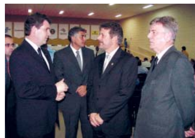
O prefeito de Mongaguá, prof. Artur Parada Prócida ao lado do prefeito de Praia Grande Alberto Mourão, participaram do 49º Congresso Estadual de Municípios

As cidades de Cubatão, Itariri, Pedro de Toledo e Juquiá completaram mais um aniversário político administrativo e as populações desses municípios fizeram questão de prestigiar, indo as ruas para assistirem os desfiles e as festividades comemorativas. Cubatão, Itariri, Pedro de Toledo e Juquiá completaram 56 anos de emancipação política com muita festa pelo progresso e desenvolvimento de cada uma.