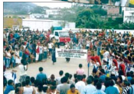
Muita festa e animação durante o desfiles 'Cívico Escolar' das Escolas da Cidade de Juquiá na Praça Rotatória.